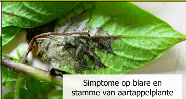
Simptome op blare en stamme van aartappelplante